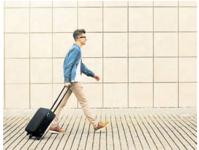
Im Ausland lernen – zahlreiche Programme fördern Auslandsaufenthalte von Auszubildenden.

Erasmus+ ist das Programm für Bildung, Jugend und Sport der Europäischen Union. Gefördert werden unter anderem Auslandsaufenthalte und Praktika