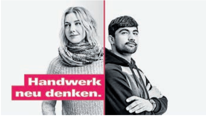
Kreative, Globetrotter, Erfinder, Klimaschützer – die Kampagne räumt mit Klischees über das Handwerk auf.