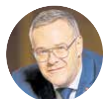
Jörg Dittrich Präsident des Zentralverbandes des Deutschen Handwerks (ZDH)

Deshalb rufen der Zentralverband des Deutschen Handwerks und die Handwerkskammer Reutlingen alle Jugendlichen auf: Wenn ihr Zukunft gestalten wollt, dann liegt ihr mit einer Ausbildung im Handwerk genau richtig. Die digitalen Informations- und Orientierungsangebote unter www.handwerk.de zeigen, welcher Ausbildungsberuf im Handwerk am besten zu euren Talenten, Fähigkeiten und Vorlieben passt. Das Lehrstellenradar und die Lehrstellenbörse der Handwerkskammer unterstützen euch bei der Suche und Auswahl des