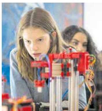
Beim Girls' Day entdecken Mädchen technische Berufe.