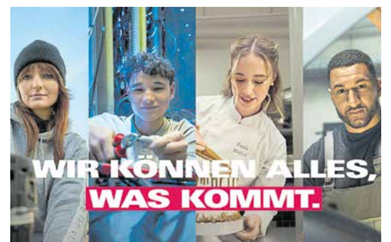
Ein Motiv der aktuellen Staffel der Imagekampagne.

Alle Vorlagen der Kampagne gibt es unter www.werbeportal.handwerk.de