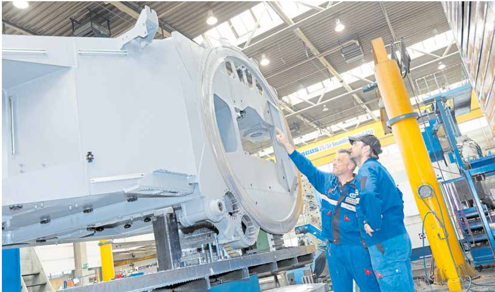
Bei den Zulieferbetrieben sind die Neuaufträge im vierten Quartal 2024 deutlich zurückgegangen.