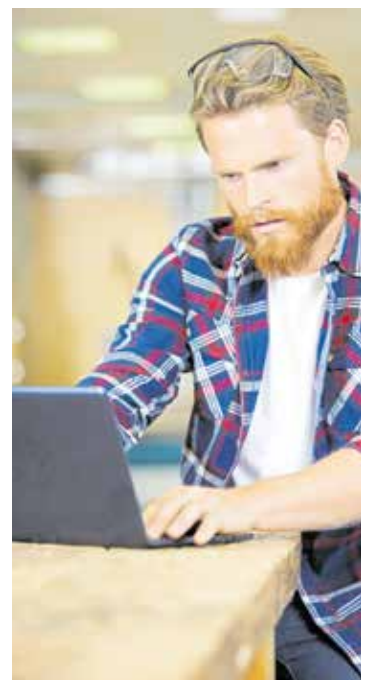
Mit der Online-Zulassung ist ein weiterer digitaler Baustein im Bereich Meisterprüfung verfügbar.

Kontakt: Team Meisterprüfung, Tel. 07121/2412-250, E-Mail: meisterpruefung@hwk-reutlingen.de